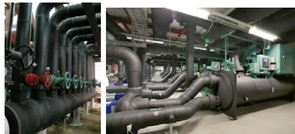
Fig. 1 Use of elastomeric foam insulation (FEF) in pipe insulation

کاربرد عایق‌های الاستومری، با رویکرد صرفه‌جویی در مصرف انرژی در کشور ما نیز رو به افزایش است چرا که استفاده از آنها روشی سریع و آسان برای عایق‌کاری حرارتی سیستم‌های لوله‌کشی است (شکل ۱). اما به دلیل ماهیت پلیمری این نوع عایق‌ها، برای کاربرد ایمن آنها به خصوص از نظر رفتار در برابر آتش، ارزیابی رفتار آنها در برابر آتش و تعیین طبقه خطر آتش آنها ضروری است. زیرا با توجه به الزامات مبحث سوم مقررات ملی ساختمان، هر نوع عایق مورد استفاده در ساختمان باید از نوع کندسوز باشد و الزامات مربوط را برآورده نماید.