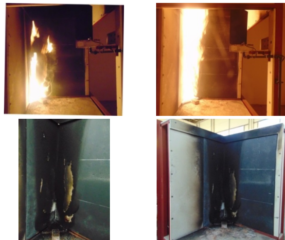
Fig. 2 FEF-EPDM during SBI fire test (above) and after test (below)

شکل ۲، یکی از آزمون‌های FEF-EPDM را حین آزمون SBI و پس از آن نشان می‌دهد. شکل ۳، منحنی شاخص گسترش آتش (FIGRA) و کل رهایش گرما (THR) را برای آزمون EPDM-2 و شکل ۴، منحنی شاخص گسترش آتش (FIGRA) و کل رهایش گرما (THR) را برای آزمون NBR/PVC-3 نشان می‌دهد.