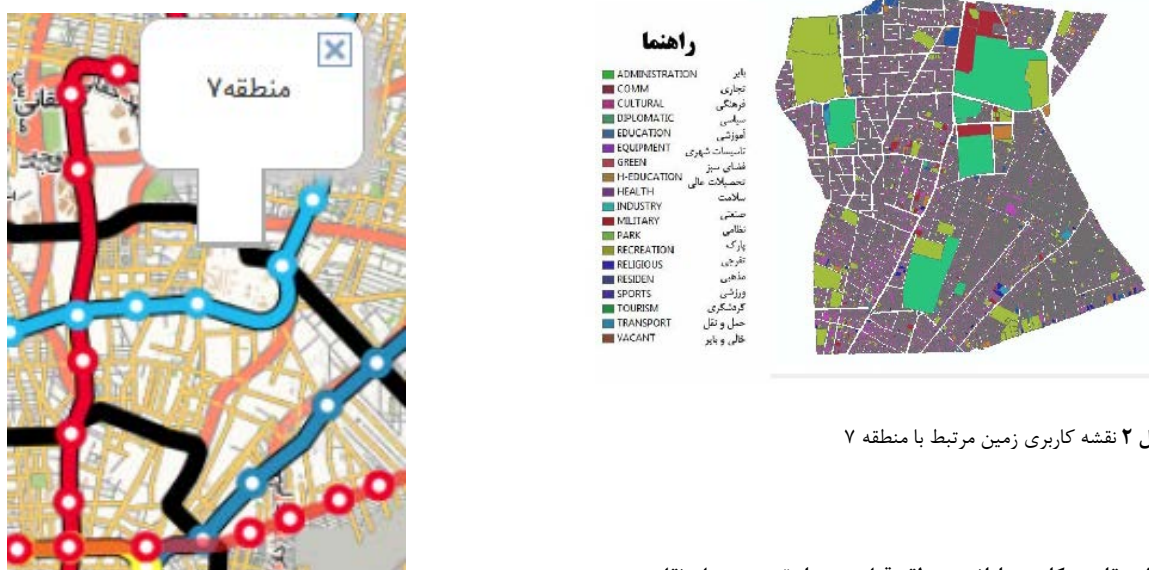
شکل ۲ نقشه کاربری زمین مرتبط با منطقه ۷