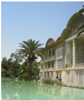
شکل ۱۱ حوض آب در مقابل کوشک باغ ارم

استخر بزرگی که در مقابل کوشک باغ ارم قرار گرفته، و تصویر عمارت در آن دیده می‌شود، بی‌کرانگی آسمان را در خود انعکاس می‌دهد. استخری با مساحت سیصد و سی و پنج مترمربع که آب ساکن را به معنای جاودانگی به نمایش می‌گذارد.