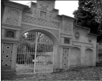
شکل ۲ درب جنوبی باغ ارم

«برگ درختان سبز در نظر هوشیار هر ورقش دفتر است معرفت کردگار»