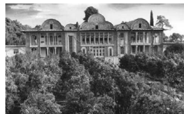
شکل ۱۴ جبهه شرقی یا باغ اندرونی و درختان نارنج باغ ارم.

هندسه پنهان: هندسه پنهان در باغ ایرانی در نظام کاشت آن متجلی می‌شود. لوریه [1986] معتقد است که ترکیب هندسه اقلیدسی و ارگانیک