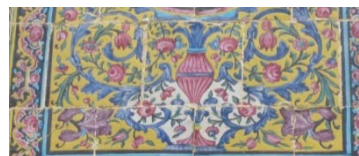
شکل ۹ نگاره‌های اسلیمی در کاشی‌های نمای شرقی کوشک