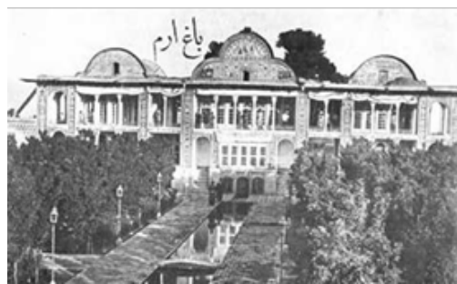
شکل ۴ نارنجستان باغ ارم و ضلع شرقی کوشک در عهد قاجاریه

حرکت مارپیچ گیاه هئوما که در اندیشه‌های ایرانی آن را درخت زندگی دانسته‌اند، در جای جای باغ دیده می‌شود. درختی زندگی‌بخش که میوه آن غذای بهشتیان است. [البرماله: ۱۳۳۲] نقوش اسلیمی در نمای ساختمان‌ها، در