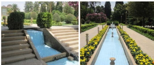
شکل ۱۰ حرکت آب و صدای جریان زندگی در باغ، منبع: نگارندگان

در باغ ارم نیز آب در جوی‌ها و حوض‌ها و حوضچه‌ها به صورتی حرکت می‌کند که بتواند تمام باغ را آبیاری نماید. آب روان در بین درختان نارنجستان و آب ساکن در استخرها و حوضچه‌ها، یادآور مفاهیم دوگانه زندگی و جاودانگی، حرکت و پویایی است. آب در باغ ارم در طی مسیر خود مدام از آبشارهای کوچک فرو می‌ریزد و صدای دلنشین آن یادآور زندگی و نشاط است.