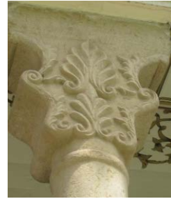
شکل ۷ سرستون ایوان شرقی کوشک [نقش درخت هیوم]

نقاشی‌های سقف کوشک و حجاری ستون‌های ایوان، گل و بوته‌های تزیینی، بهشت را در ذهن مخاطب ترسیم می‌کنند.