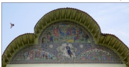
شکل ۶ ستوری نصب شده در کوشک باغ ارم؛ منبع: نگارندگان

تراس‌بندی شیب طبیعی زمین در امتداد مسیرها، نوعی سلسله مراتب حرکتی ایجاد می‌کنند. در باغ ارم نیز این مفهوم به خوبی قابل مشاهده و بازشناسی است. شیب زمین از غرب به سوی شرق است. طراح از این فرصت برای تراس‌بندی در مسیر حرکت در حدفاصل سردر تا کوشک، به‌خصوص در محور اصلی باغ سود جسته است.