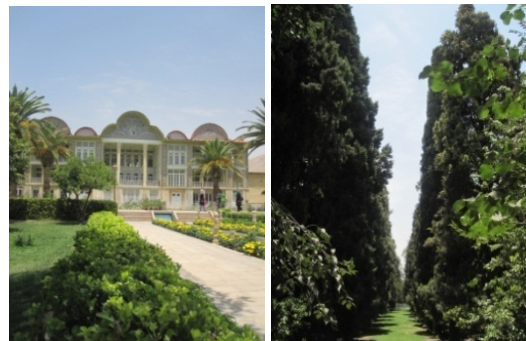
شکل ۱۳ ردیف درختان سرو و شمشاد در محورهای باغ

ردیف سروها مشوق حرکت مخاطب در مسیری است که در رسیدن به بی‌نهایت وجود آغاز کرده است. علاوه بر آن، فرم کشیده و هرمی آن در طول مسیر با تاکید بر خطوط عمودی پرسپکتیوی بی‌نهایت را ایجاد می‌نماید.