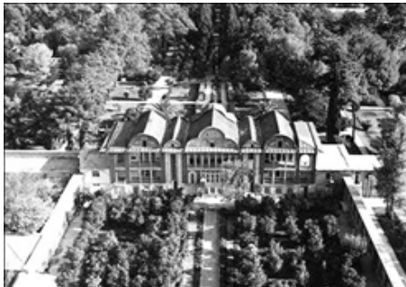
شکل ۳ منظره‌هایی باغ اندرونی در باغ ارم، منبع: اصداقت کیش، ۱۳۸۶

«در گلستان ارم دوش چو از لطف هوا زلف سنبل ز نسیم سحری می‌آشفت گفتم ای مسند جم، جام جهان بینت کو گفت افسوس که آن دولت بیدار بخت»