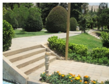
شکل ۵ تراس بندی و سلسله مراتب دسترسی در باغ ارم؛ منبع: نگارندگان

باغ ارم هرچند دارای المان‌های معمول ورودی مانند هشتی و دالان نیست، اما تزئینات سردر جنوبی باغ ارم با ترکیب آجر و کاشی که با ظرافت و زیبایی بسیار انجام شده است، ناشی از اهمیت سردر نزد طراح آن است.